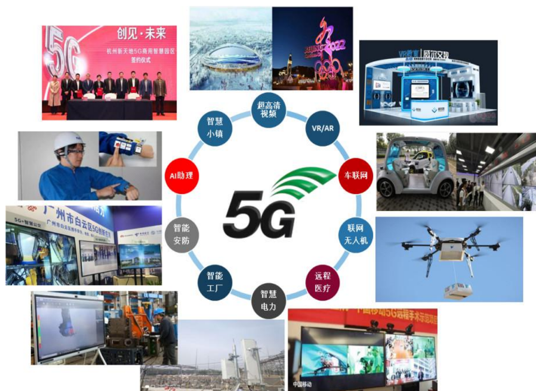
图 1-1 5G 移动通信产业跨界融合步伐不断加快

兴未艾，以泛在网络、数据互联、工控防护、云边协同、物联感知以及智能制造为核心的新型制造业将迅速进入垂直行业，引领消费网络和技术网络整体提升。可以预见的是，未来生物医药、新能源、新材料等领域与大数据、云计算、人工智能、区块链的结合愈加紧密，现代服务业与先进制造业深度融合趋势愈加明显，将对整个经济社会发展产生不可预估的作用。